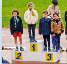
Podium du cross départemental UGSEL