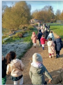
Promenade autour du lac

Le projet « sport et santé » pour les CM en collaboration avec l'ASC est planifié. Nous parlerons à cette occasion du danger des écrans et des mauvaises habitudes alimentaires, tout en découvrant des sports innovants. Un cycle de voile, doit également voir le jour en fin d'année et devrait nous apprendre beaucoup de choses sur la navigation mais aussi sur l'étang d'Ecluzelles.