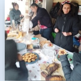
Goûter / livraison des sapins de Noël par l'APEL

Nous tenons aussi à mettre à l'honneur les membres de notre APEL. Leur engagement, nous permettent de porter des projets qu'il nous tient à cœur de proposer à nos élèves. Ce sont des acteurs importants de la vie de l'école (organisation de la fête de l'automne, vente de sapins de Noël, spectacle et marché de Noël à la salle Pommereau, emballage de cadeaux, vente de gâteaux, recherche de subvention...). Les enseignants, les familles et les enfants les remercient pour leur soutien et leur dynamisme !