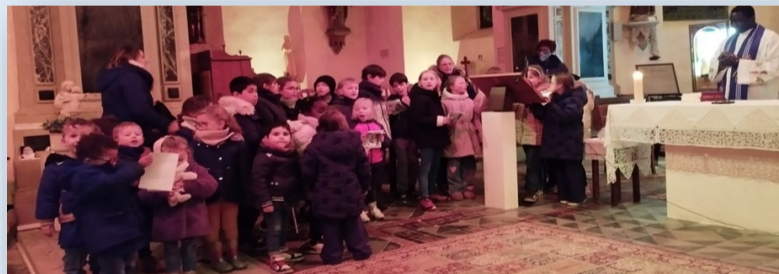
Messe des familles de l'école (1er mardi de chaque mois à partir de 16h45 jusqu'en juin). Vous y êtes tous conviés !

Nous tenons aussi à mettre à l'honneur les membres de notre APEL. Leur engagement, nous permettent de porter des projets qu'il nous tient à cœur de proposer à nos élèves. Ce sont des acteurs importants de la vie de l'école (organisation de la fête de l'automne, vente de sapins de Noël, spectacle et marché de Noël à la salle Pommereau, emballage de cadeaux, vente de gâteaux, recherche de subvention...). Les enseignants, les familles et les enfants les remercient pour leur soutien et leur dynamisme !