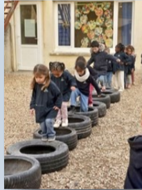
Sport dans la cour de l'école